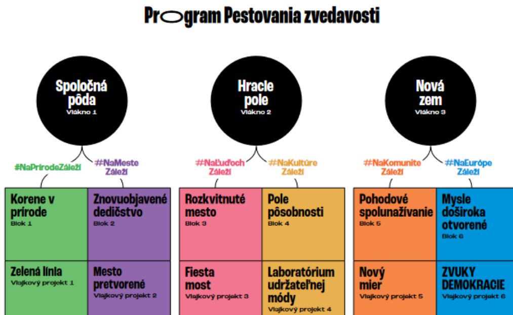
Obrázok 1: Kultúrny program Pestovania zvedavosti

Kultúrny program projektu EHMK nesie názov „ Pestovanie zvedavosti “ a zahŕňa viac ako 50 projektov v troch hlavných vláknach: (1) Spoločná pôda - zameranie na prírodné a historické dedičstvo, (2) Hracie pole – zameranie na rozšírenie kultúrnej ponuky a kreatívny priemysel, (3) Nová zem - zameranie na budúcnosť a spoločenské témy. Každý programový okruh sa delí na dva bloky zamerané na šesť nosných tém: (1) #NaPrírodeZáleží , (2) #NaMesteZáleží , (3) #NaĽuďochZáleží , (4) #NaKultúreZáleží , (5) #NaKomunitěZáleží a (6) #NaEurópeZáleží . V nadväznosti na tieto témy sú vytvorené programové bloky, ktoré priamo súvisia s napĺňaním cieľov projektu. Tieto sú graficky znázornené v schéme kultúrneho programu Pestovania zvedavosti na Obrázku 1 .